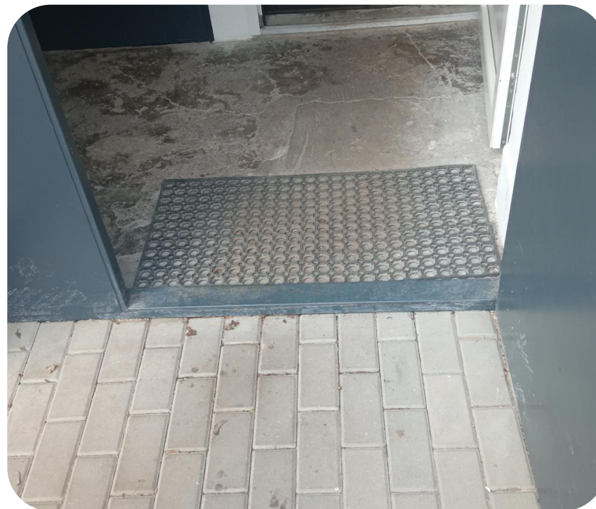
Įrengtas netinkamas slenkstis 3,5 cm aukščio