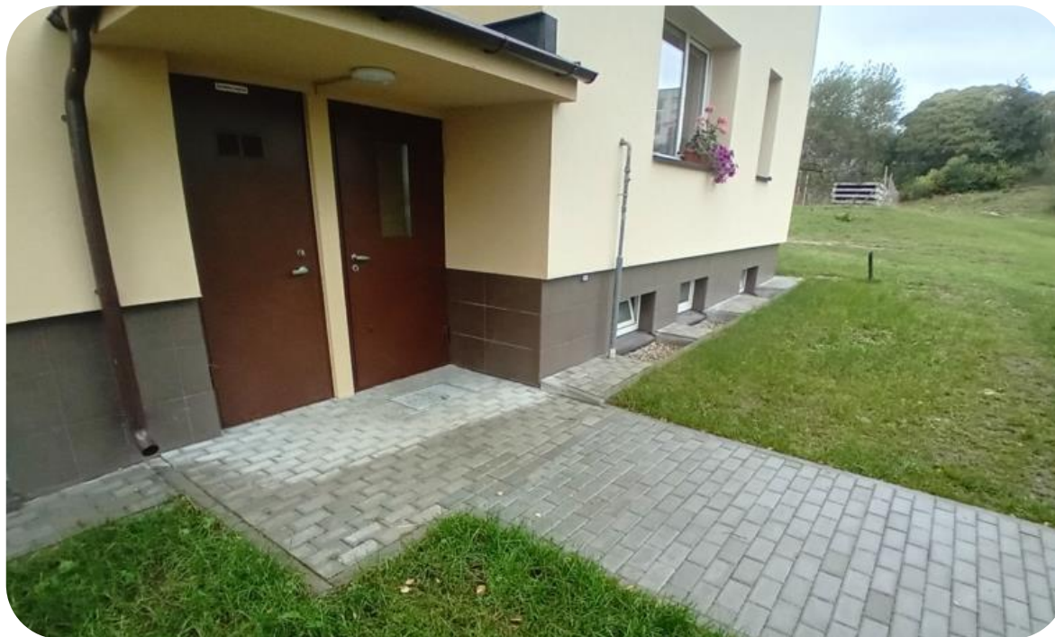
Neįrengti įspėjamieji paviršiai